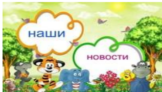
Фото с проекта по математике.